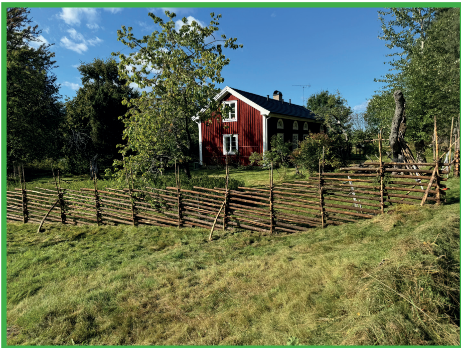
Många hus i Småland var röda och vita när Astrid Lindgren var barn.