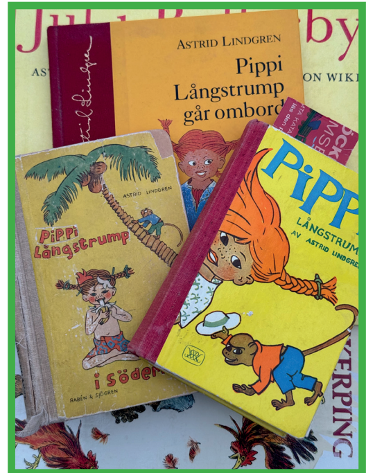
Det finns flera böcker om Pippi Långstrump.

Pippi är en stark, modig och snäll flicka som bor ensam i Villa Villekulla tillsammans med sin apa Herr Nilsson och hästen Lilla Gubben.