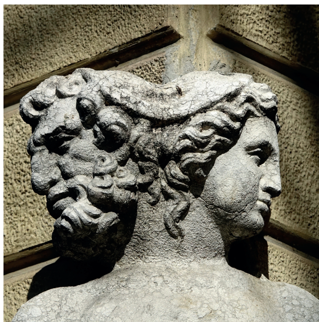
Staty med guden Janus

Namnet betyder guden Janus månad . Janus var en gud som man trodde på för väldigt länge sedan i det romerska riket.